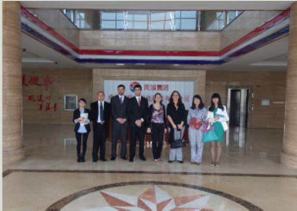
Fábrica de paneles solares