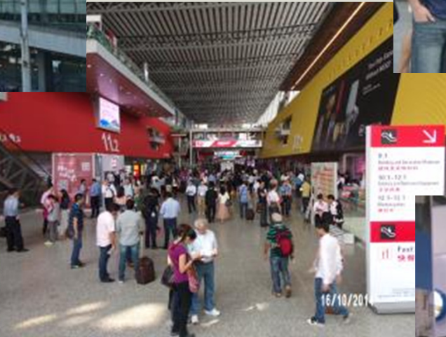
Feria de Cantón