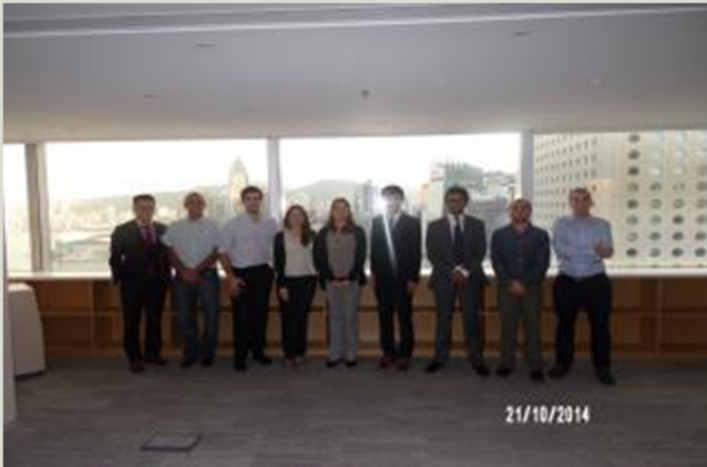
HK International Arbitration Center