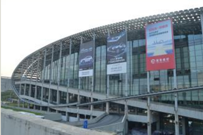
Complejo Pazhou Feria de Cantón