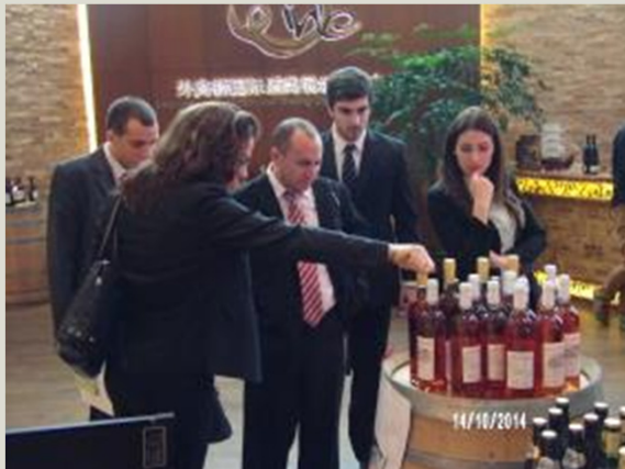
Centro de Exhibición y promoción de Vinos en la Zona Franca Waigaoqiao