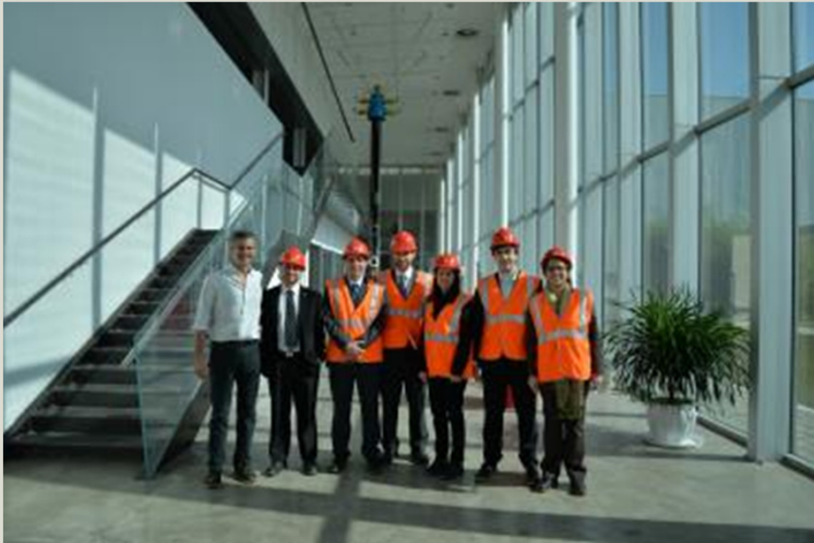
Tenaris Steel Pipe Co.