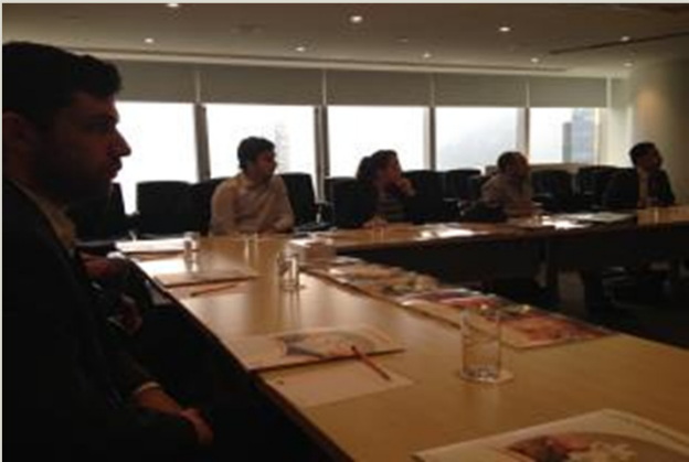
CWCC International Business Consultancy