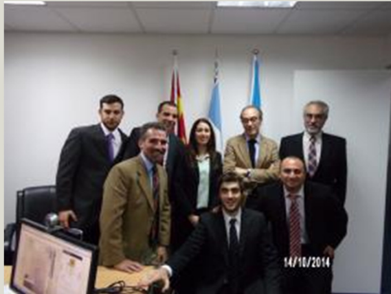
Consulado Argentino y Centro de Promoción Comercial