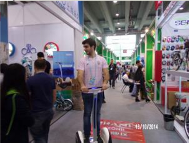
Feria de Cantón