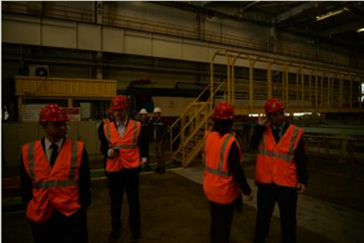
Tenaris Steel Pipe Co.