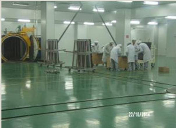
Fábrica de paneles solares