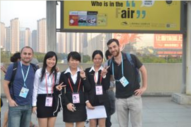
Feria de Cantón