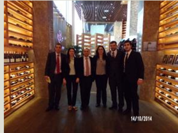
Centro de Exhibición y promoción de Vinos en la Zona Franca Waigaoqiao