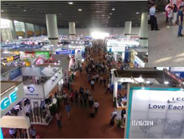
Feria de Cantón