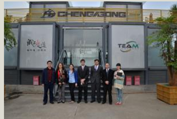
Fábrica de máquinas retroexcavadoras