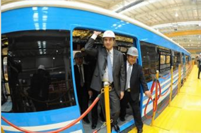
CSR Qingdao Sifang