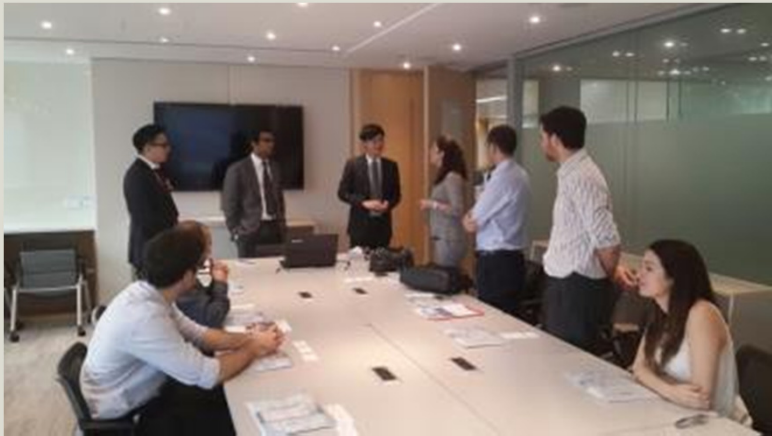
HK International Arbitration Center