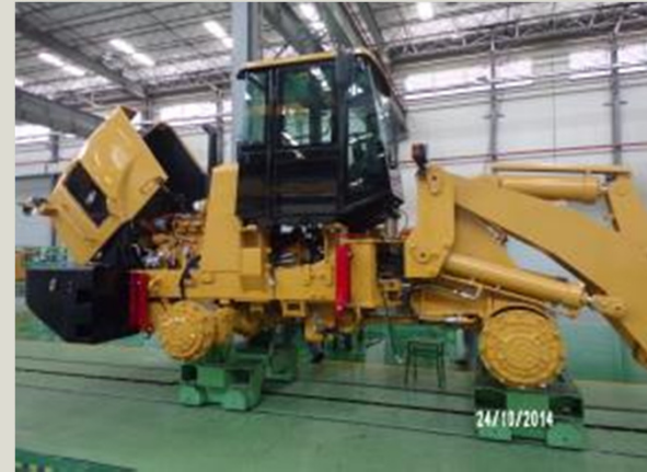
Fábrica de máquinas retroexcavadoras