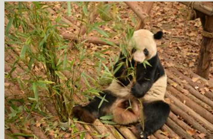
Chengdu Research Base of Giant Panda Breeding