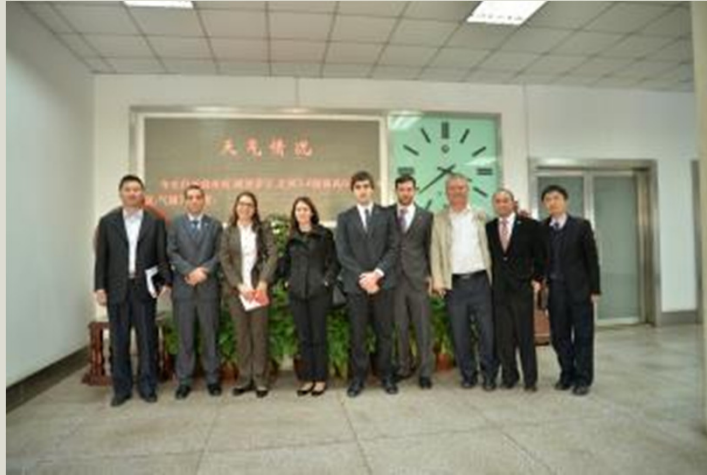
Puerto de Qingdao