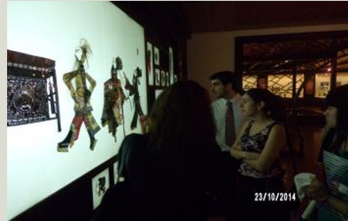
Museo de la Universidad de Sichuan