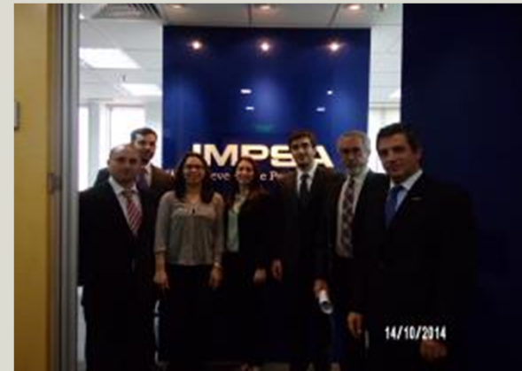
Oficinas de IMPESA