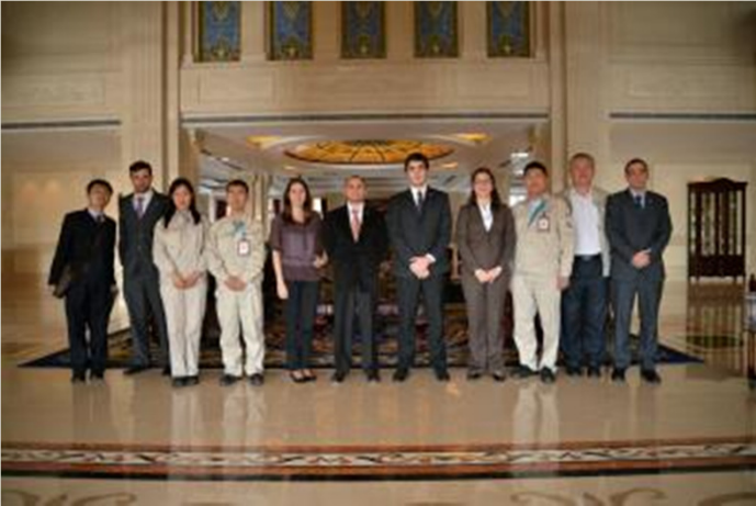
CSR Qingdao Sifang