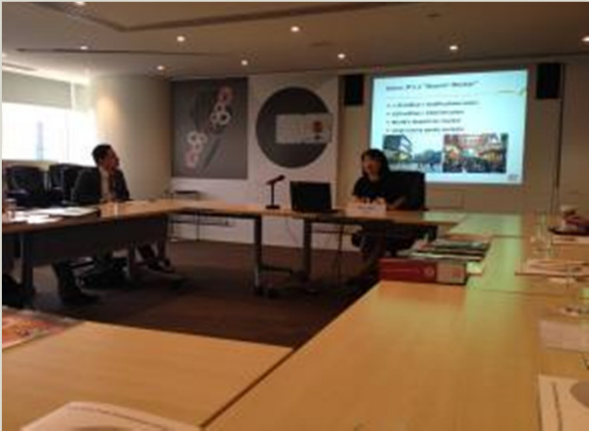
Hong Kong Trade Development Council