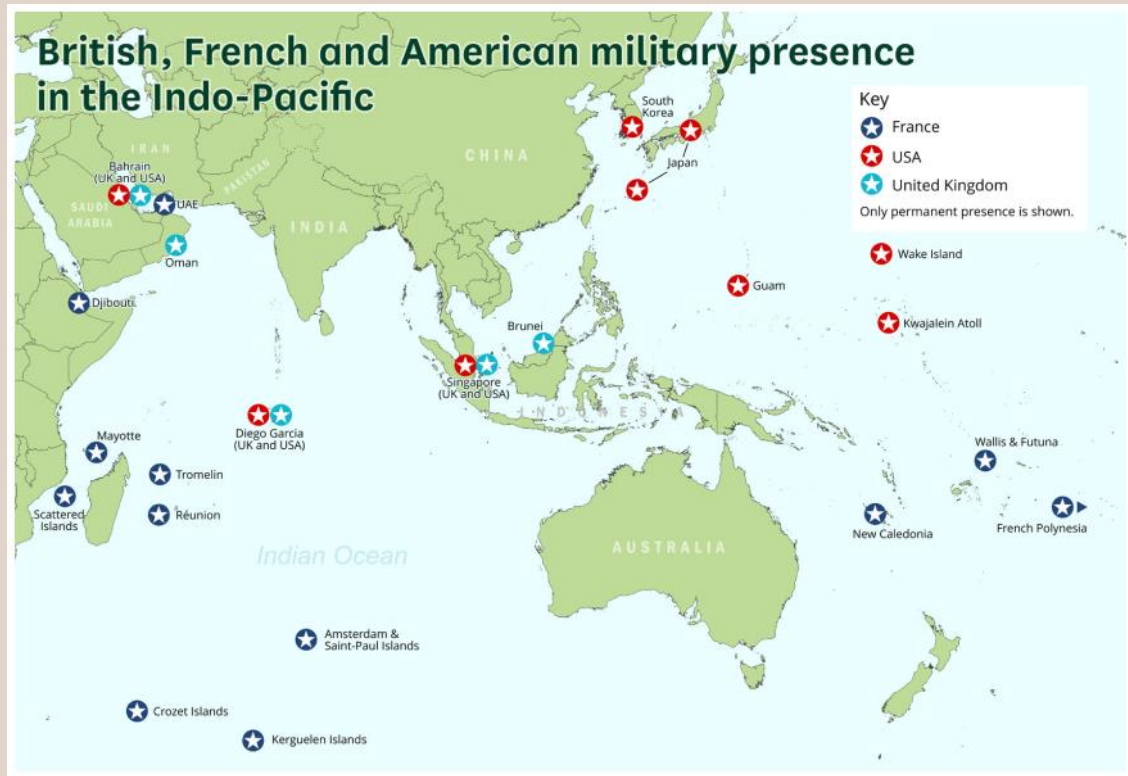
Mapa 2: Presencia militar británica, francesa y estadounidense en el Indo-Pacífico.